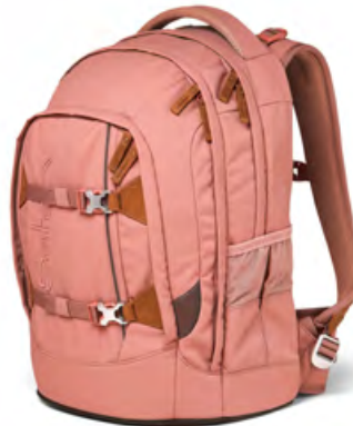
Pack „Nordic Coral“ für 159,99 €