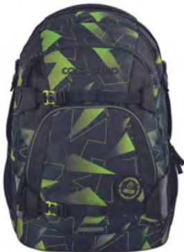
Mate „Lime Flash“ für 139,99 €