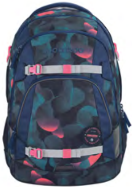
Mate „Cloudy Peach“ für 139,99 €

Neue Satch-Kollektion ab April verfügbar!