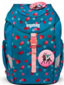
„ VoltiBär “ für 44,99 €