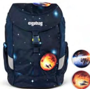
Galaxy „KoBärnikus“ für 49,99 €