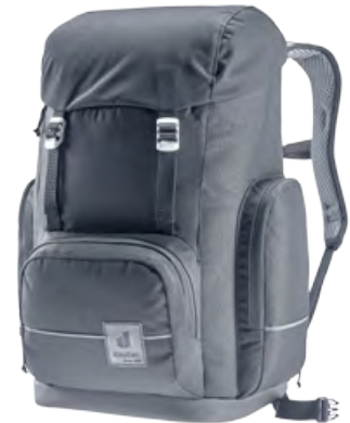
Scula „black“ für 160,- €

Zu allen Rucksäcken haben wir natürlich auch das passende Zubehör wie Sporttasche, Schlumperbox, etc.