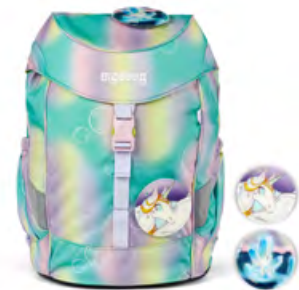
Reflex „ZauBärwelt“ für 49,99 €