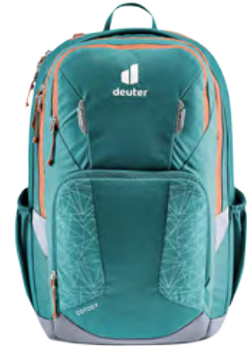
Cotogy „deepsea“ für 140,- €