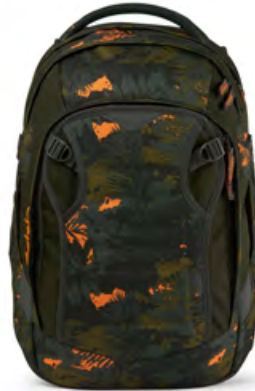
Match „Jurassic Jungle“ für 149,99 €